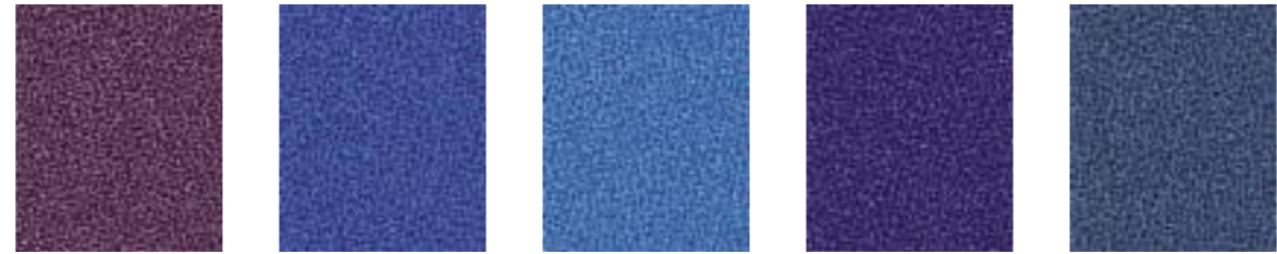
Galway JA023 Toronto JA432 Hercules JA433 Bluebell JA015 Niagara JA437