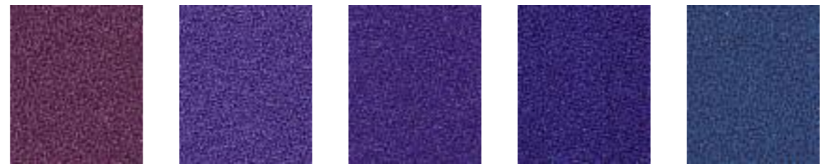
Heliodor JA430 Crush JA058 Dresden JA025 Statice JA056 Boehme JA438