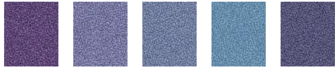
Taffeta JA190 Hameln JA041 Iceberg JA195 Spa JA436 Porcelain JA024