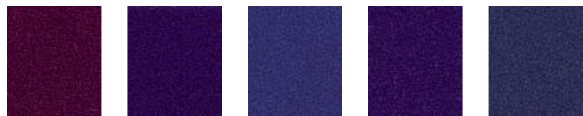
Poison JA084 Purple JA157 Pascal JA434 Elderberry JA057 Rocket JA439