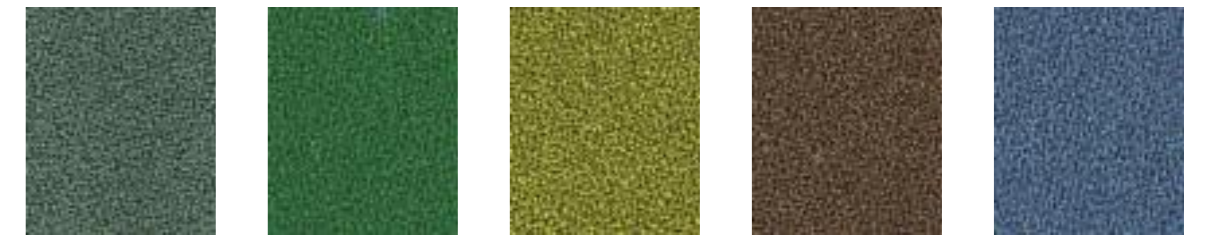
Orion JA021 Chomsky JA443 Courgette JA201 Mushroom JA125 Resin JA447