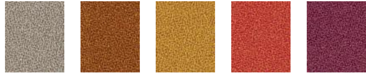
Ceres JA409 Caribou JA176 Zippy JA426 Circus JA428 Rouge JA010