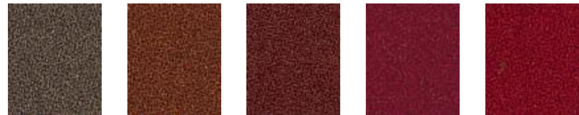
Gazelle JA424 Munchkin JA029 Cinnabar JA060 Cherry JA419 Rosso JA008