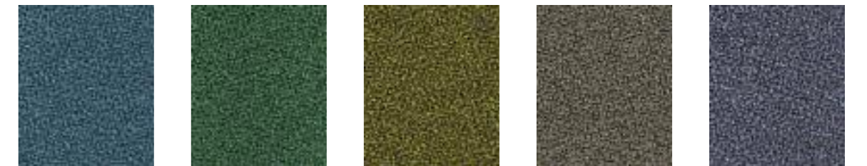
Manta JA194 Garland JA019 Pesto JA169 Rhino JA022 Dolphin JA017