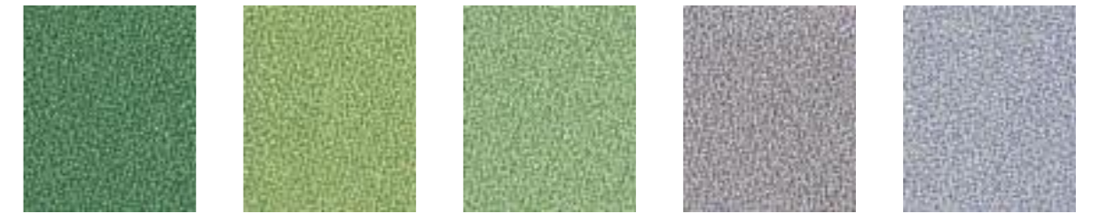
Voltaire JA440 Weil JA038 Covellite JA444 Aristotle JA416 Socrates JA446