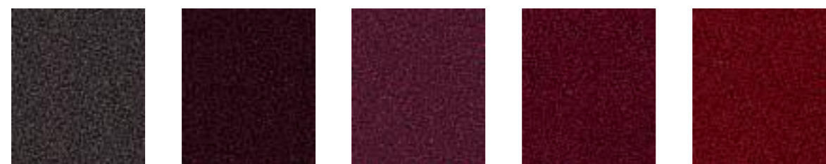
Witch Hazel JA425 Canasta JA184 Aniseed JA427 Vermillion JA062 Zinnia JA009