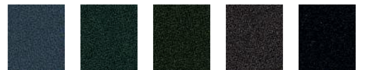
Frege JA441 Foxtail JA065 Nardus JA066 Swart JA069 Pitch JA002