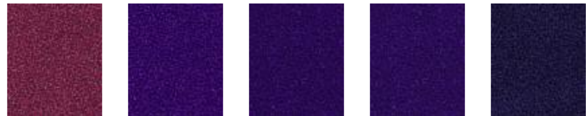
Jubilee JA431 Tyrian JA072 Bluebottle JA079 Smurf JA159 Geyser JA193