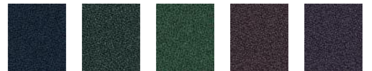
Biscay JA059 Pine JA020 Troy JA408 Heron JA001 Smoke JA028