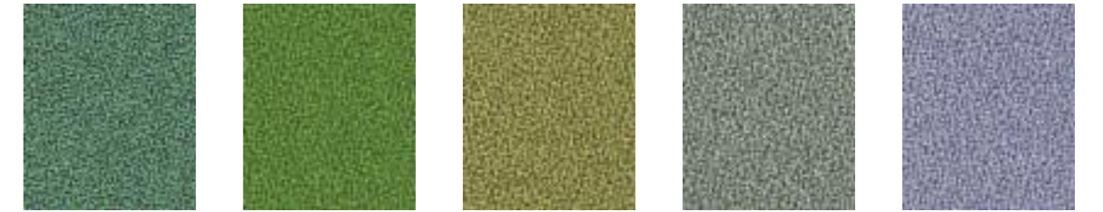
Mexico JA018 Tombola JA442 Bamboo JA445 Plato JA406 Poseiden JA414