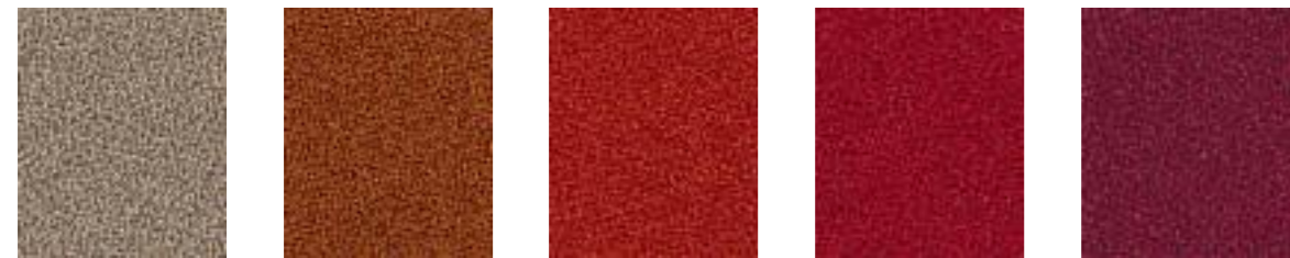
Womble JA423 Amber JA068 Tambourine JA183 Jezebel JA027 Galileo JA429