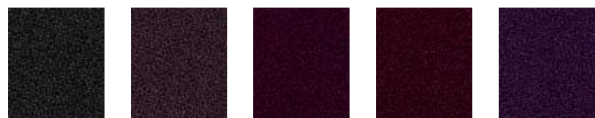
Spinoza JA448 Polyhymnia JA413 Albany JA187 Posella JA012 Amanda JA033