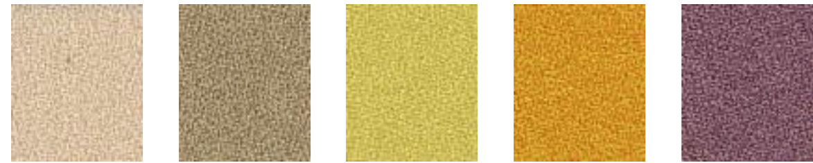
Sugar JA422 Athene JA411 Hera JA410 Citrus JA026 Pimpernel JA011