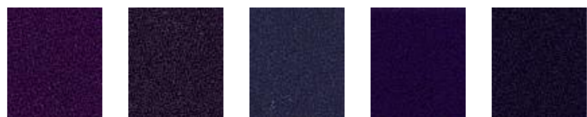
Paderborn JA047 Raisin JA061 Vico JA435 Leipzig JA046 Mariner JA016