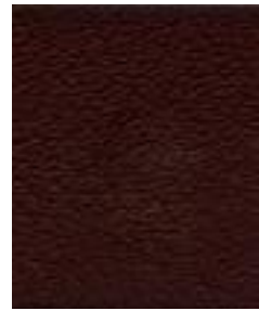
negro braun 55-50385