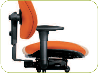
Serienmäßige Sitzneigeverstellung mit 0° und 4° Vorneigung.