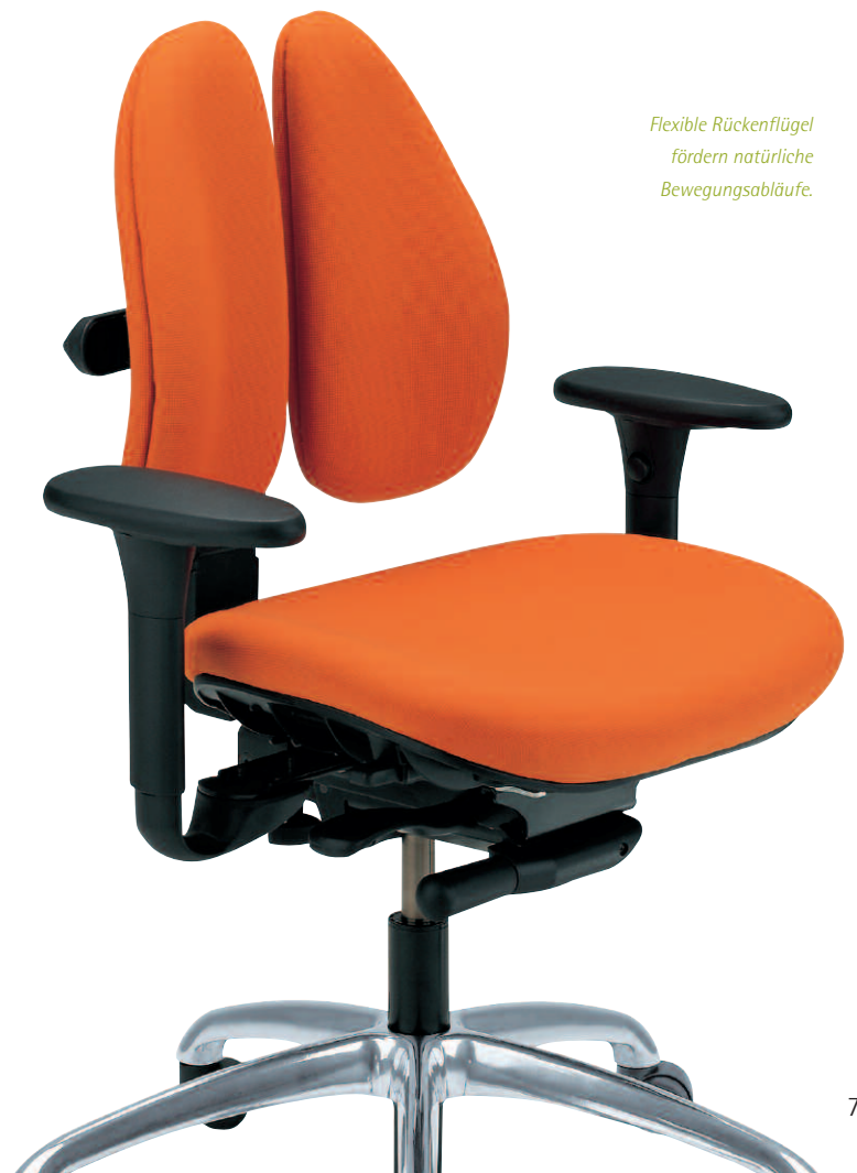
Flexible Rückenflügel fördern natürliche Bewegungsabläufe.