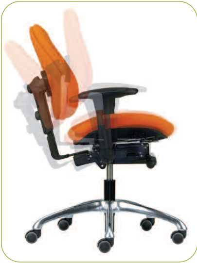
Dynamisches Sitzen ist Einstellungssache.