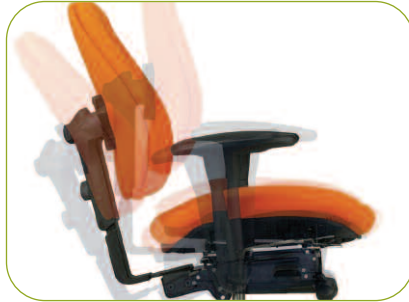
Synchronmechanik mit einem Öffnungswinkel von 105° bis 125,5°. Verhältnis 1:2,9.