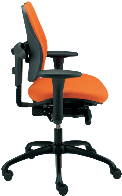
Die Kombination von Schiebesitz und flexibel gelagerten Rückenflügeln bietet Sitzkomfort auf höchstem ergonomischen Niveau.

Die Position der beiden flexiblen duo back® -Rückenflügel kann in Höhe und Breite optimal angepasst werden und auch die Armlehnen lassen sich in Breite, Höhe und Tiefe individuell einstellen. Als Armauflagen dienen Soft-Pads aus PU-Schaum. Die Sitztiefe kann mittels Knopfdruck variiert werden.